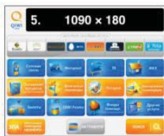
Страница выбора категории