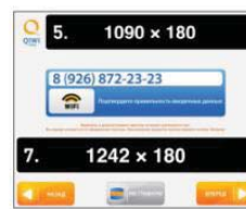
Страница подтверждения номера