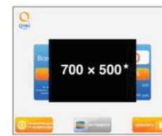
Страница оплаты услуг

Контакт со всеми пользователями терминала