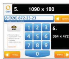
Страница ввода номера