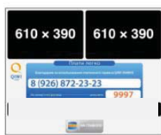
Страница завершения платежа